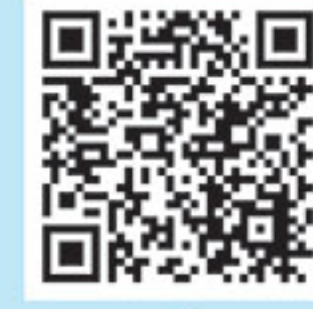
جهت مشاهده ویدئوی کامل این کیوآر کد را اسکن کنید.

امید آن داریم که این آغاز شیرین، انگیزه‌های باشد برای تلاش بیشتر و فردایی روشن‌تر برای همه فرزندان ایران عزیزمان.